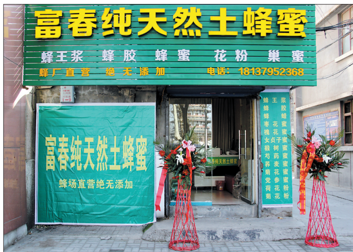
富春纯天然土蜂蜜中州路店

洛阳蟹之家负责人介绍,蟹的品质与产蟹湖区的生态环境直接“挂钩”,阳澄湖优质的生态环境和丰富的水生生物