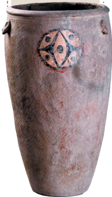
“伊川缸”(现藏于洛阳博物馆)