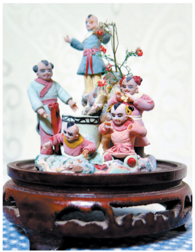
以前的作品只剩下这一件了,她打算重拾手艺