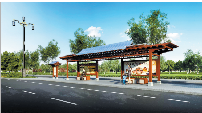
仿唐廊亭造型公交站效果图 (本版图片均为资料图片)