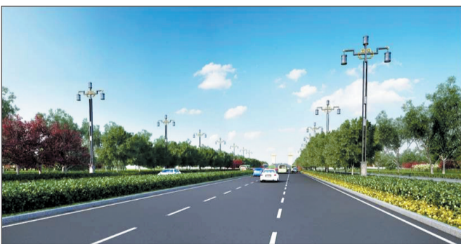
新伊大街仿唐宫灯造型路灯效果图