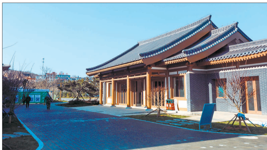
龙门石窟景区西北服务区

龙门游玩既可选择在这里购票,也可到东北服务区。不过,由于这两个服务区功能互补,满足需求不同,而且东北服务区有6000余个车位,建议自驾游客还是从东北服务区购票进入景区为宜,乘坐公交车来的游客在西北