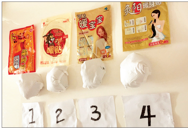
分别使用4个不同品牌的暖宝宝包裹的鸡蛋

暖宝宝的威力究竟有多大?它的工作原理是什么?使用时要注意什么?《洛阳晚报》记者与医生一起通过实验为您揭秘。