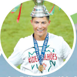
克里斯蒂亚诺·罗纳尔多