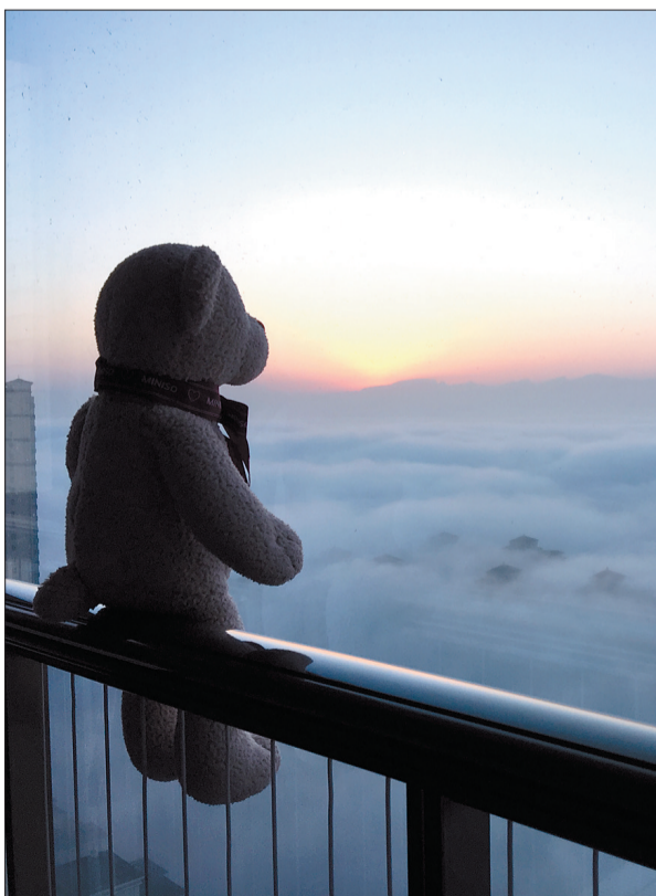
晚报拍客 张浩杰 摄于恒大绿洲