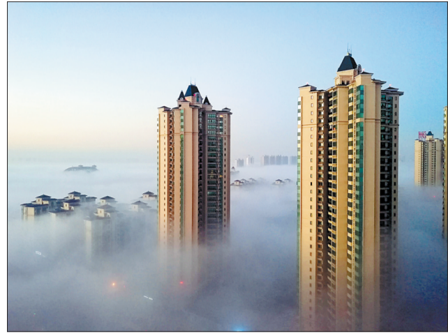
晚报拍客 兰丽君 摄于恒大绿洲