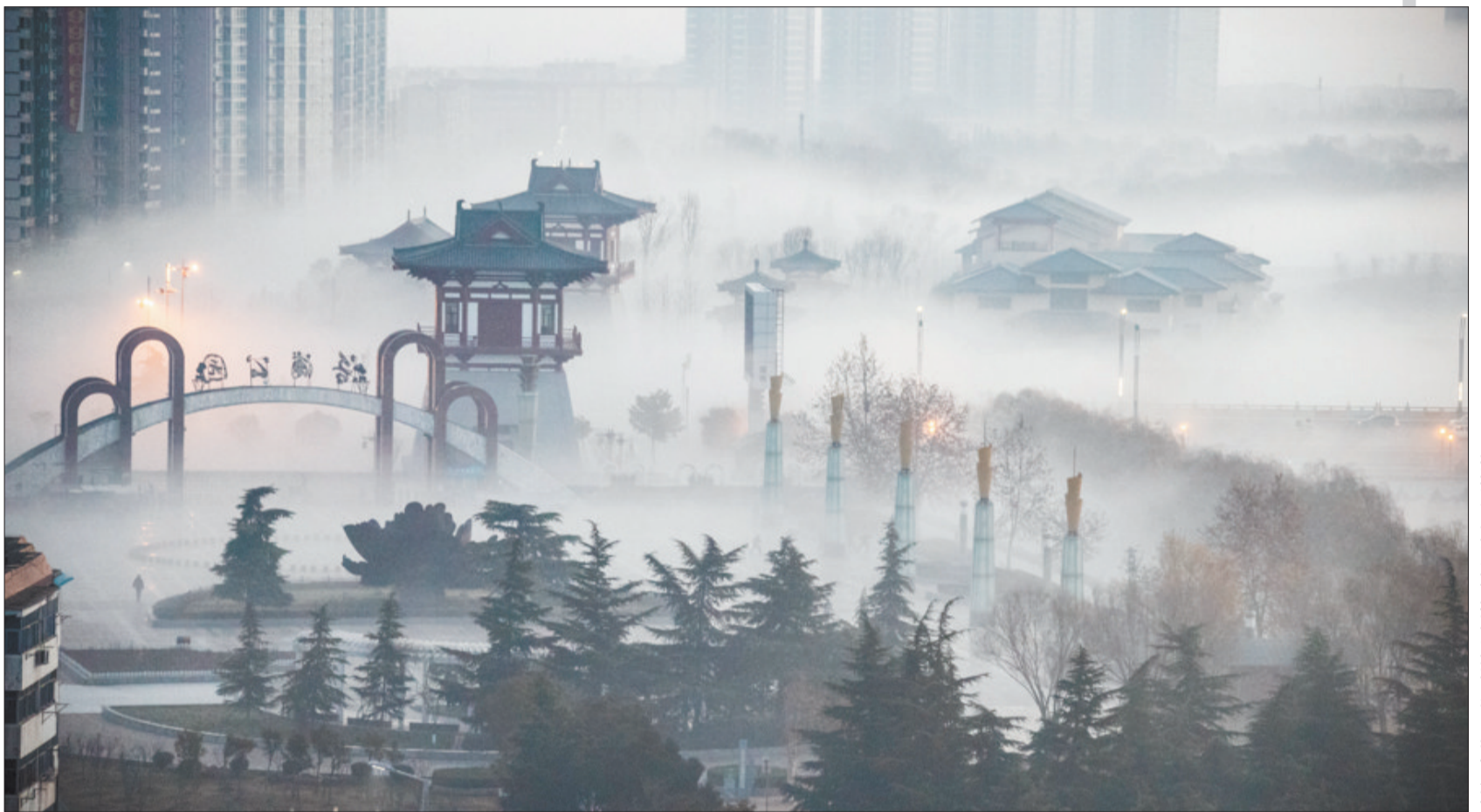
晚报拍客 郭万超 摄于玻璃厂南路耶赐城