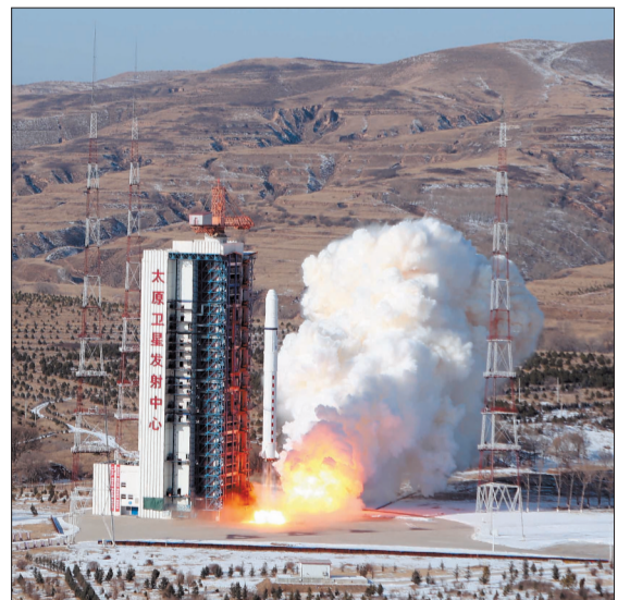
发射现场

据了解,北京市八一学校师生代表在太原卫星发射中心现场观看了发射,并与科研人员进行了航天科普交流活动。“八一·少年行”卫星在轨运行期间,航天专家将与八一学校联合组织天地协同的教育和科普活动,以此提升中小学生对航天技术的认知,激发学生想象力和创造力,展示航天科学技术魅力,形成航天科学教育课程体系,助力中学科学教育实践目标的实现。