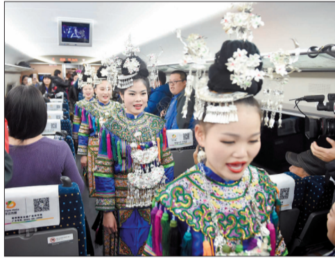
▲苗族同胞在车上唱起苗族民歌 ▲12月28日,由贵阳开往昆明的G4135次列车经过贵州省安顺市境内的水桶木寨特大桥