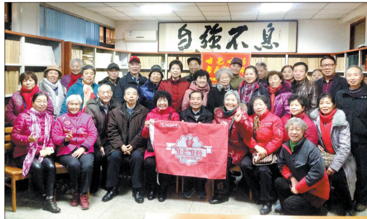
2016年顺利收官，来张大合影

10期微信培训班，300余名学员，每次都是报名踊跃、一座难求，这从一个侧面反映出老年人对学微信的渴望。他们为什么想学微信？“小棉袄”对“咱爸咱妈老友聚乐部”的会员进行了问卷调查。