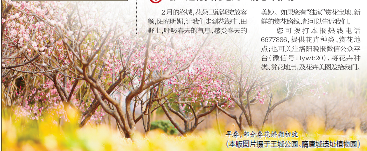
早春,部分春花娇颜初绽 (本版图片摄于王城公园、隋唐城遗址植物园)

您可拨打本报热线电话6677886,提供花卉种类、赏花地点;也可关注洛阳晚报微信公众平台(微信号:lywb20),将花卉种类、赏花地点,及花卉美图发给我们。