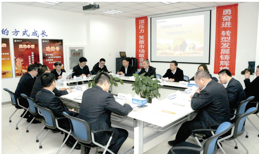
建行河南省分行在洛阳召开金融创新研讨会