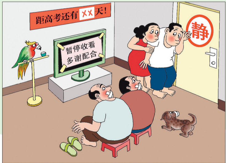
▲重中之重 邱天行 (天津)