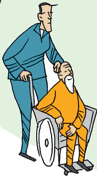
▲反哺 盖桂保 (山东)