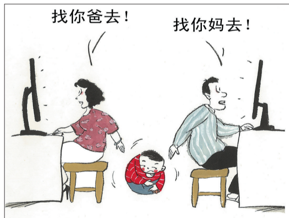
▲球 于晏晏 (山东)