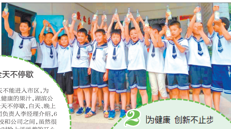
湖滨果汁到手,开心合个影

今天是六一儿童节,祝所有小朋友、大朋友节日快乐。对于全市52所中小学的学生来说,他们早早地收到了一份特殊的节日礼物——健康、绿色、天然湖滨果汁。5月22日,洛阳市小记者协会、洛报小记者俱乐部联合洛阳湖滨食品有限公司(以下简称湖滨公司)举办的“迎六一 清爽果汁进校园”大型公益赠饮活动举行了启动仪式。在接下来的6天时间里,湖滨公司配送团队赶在六一儿童节之前,马不停蹄地将17余万瓶果汁送到小朋友们的手中,为他们送上清凉、健康的节日礼物。