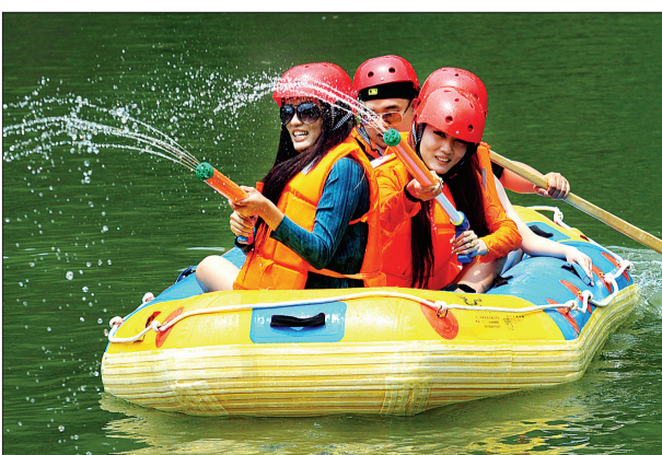
游客在恐龙谷漂流