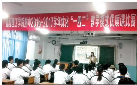
“一四二”教学模式优质课大赛 (本版图片均为资料图片)