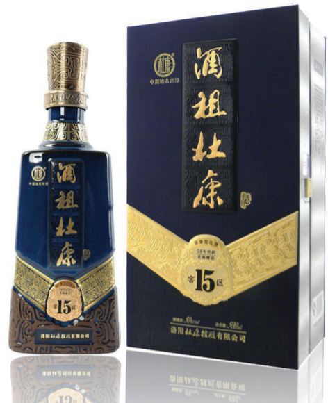
荣获金奖的杜康酒