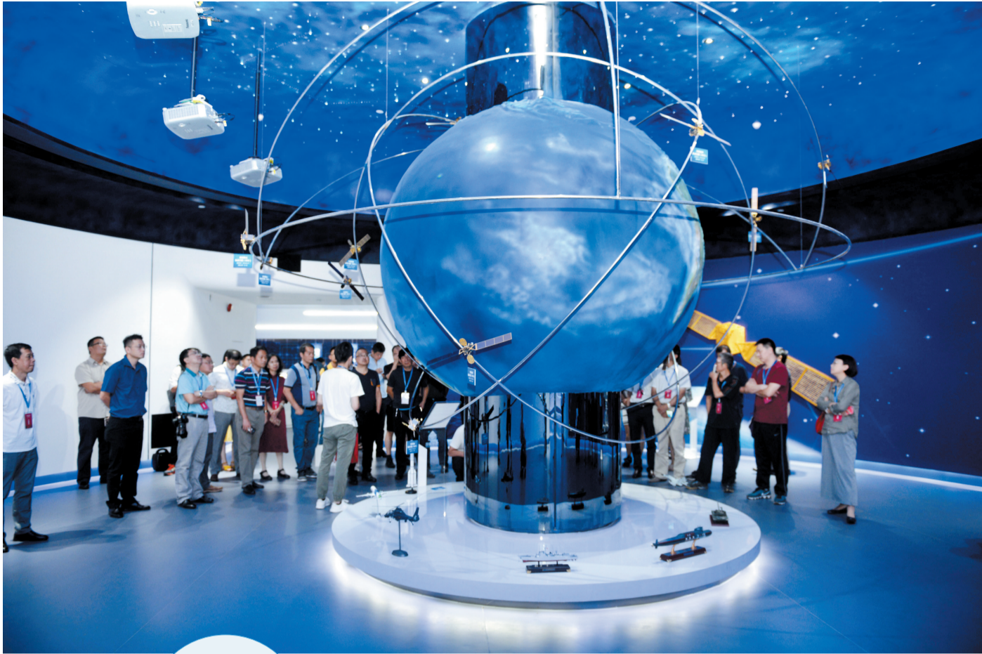
连续十四年入选中国软件业务收入前百家企业的海格北斗产业集群