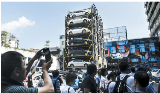
“五号空间”创业园内的立体停车场