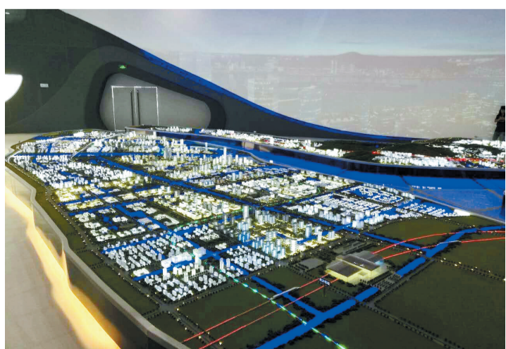
南沙新区，广州未来的中心