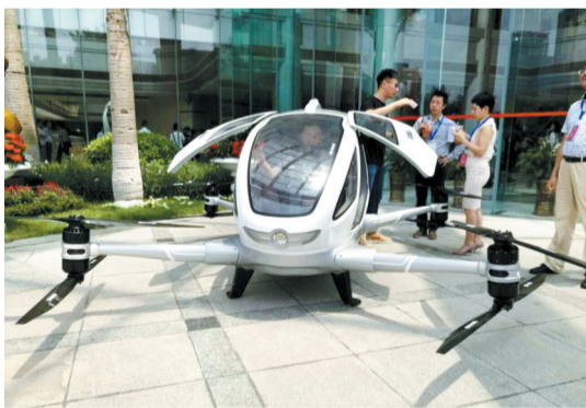
可载人锂电池航拍机

拥有7434平方公里、1400多万人口的广州，是广东省省会。国家历史文化名城、我国重要的中心城市、国际商贸中心和综合交通枢纽……今年2月，国务院正式批复广州的最新城市定位。未来，广州将强化与香港、澳门的深度合作，成为21世纪海上丝绸之路重要枢纽，广东自贸区南沙片区将建成粤港澳深度合作示范区。