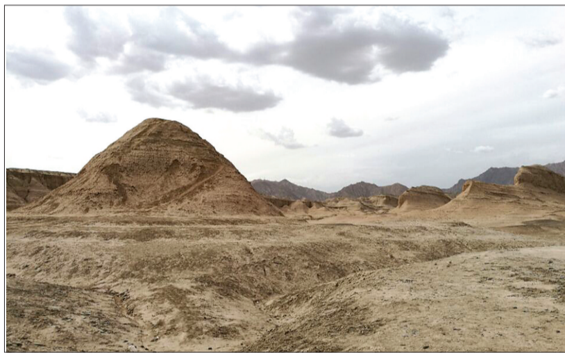
库车(古龟兹)的雅丹地貌