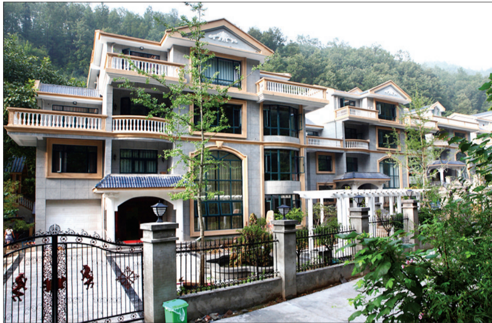
洛阳市涧西区养老服务中心建在养子沟风景区外的别墅

如今,老年人流行“候鸟”式养老。随着高速公路、快速通道的开通,农家乐、生态园等旅游设施的完善,加上周边县区山清水秀、气候宜人,洛阳的很多老年人不再走出洛阳,而是选择在家门口养老,就连外地的“候鸟”也飞到洛阳来了。