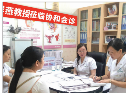
北京阮祥燕教授首次到洛阳协和医院爱心助孕现场

10月6日,北京妇产医院内分泌科主任、医学博士后、博士研究生导师阮祥燕教授将领衔启动“京·郑·洛不孕不育专家爱心助孕行动”,在洛阳协和医院免费坐诊。