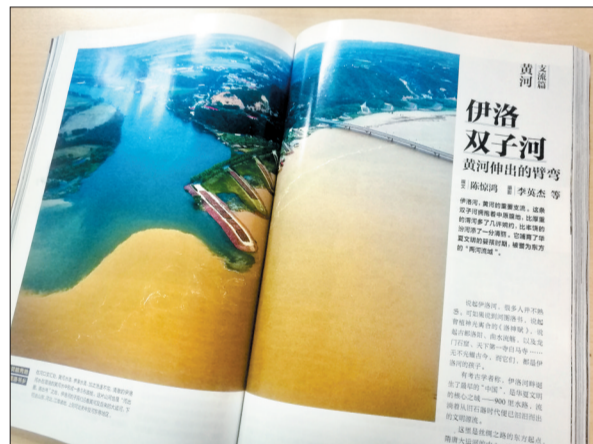
▲其中关于洛阳的内容