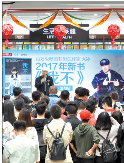
大冰《我不》读者见面会

18日晚7点多,洛阳购书中心热闹非凡。大冰《我不》百城百校洛阳站、洛阳读者见面会开始不久,数不清的年轻读者抱着书,排着队等签名,队伍在书架间绕来绕去,整整绕了两层楼。