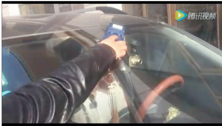
上图：拿POS机在风挡玻璃处一挥