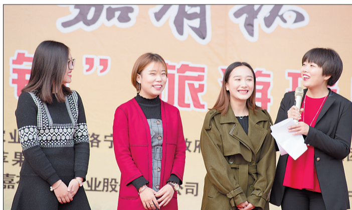
▶▶ 参展苹果 评选旅游形象大使

除了常规项目考核，大赛重在对苹果样品进行农药残留检测，并实行一票否决，评审专家组成员来自中国农科院郑州果树研究所资源与育种研究室、国家苹果产业技术