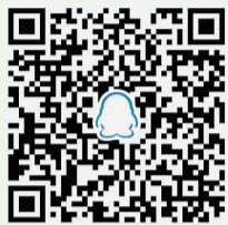
洛阳晚报小作家群