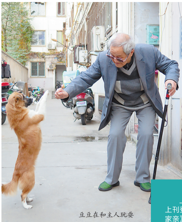
豆豆在和主人玩耍