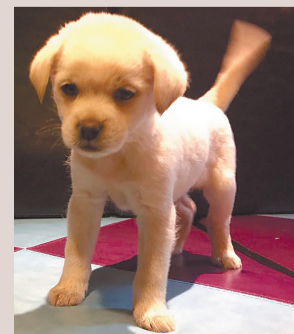
等待被领养的小狗来福

这几天，洛阳小动物保护协会(以下简称动保协会)遇到了难题。随着被救助宠物数量的增加，动保协会救助的幼犬没地方住了，最小的才刚刚满月。