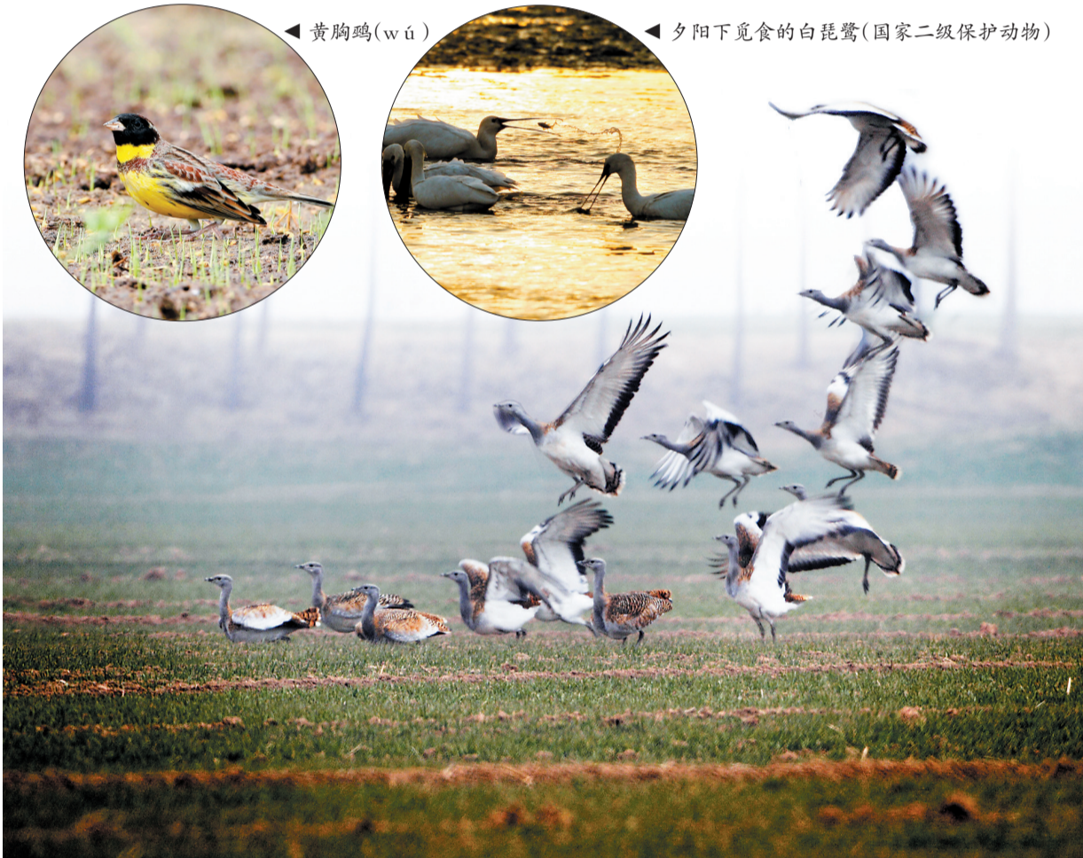
大鸨(gǎo)(国家一级保护动物)