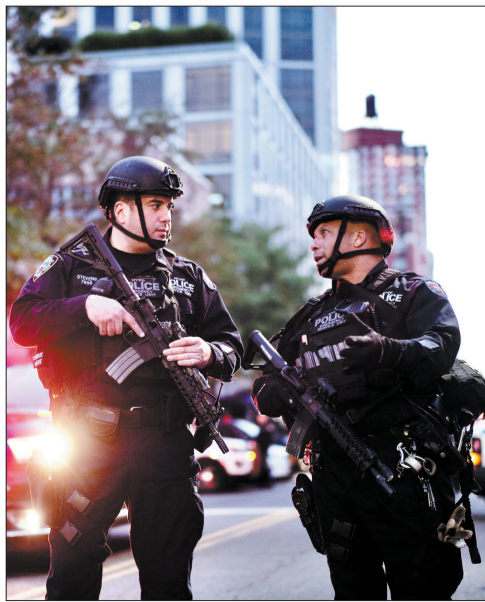
警察在袭击事件现场附近警戒

新华社驻纽约记者谢锴说，在距离袭击地点大约1公里的路程，庆祝万圣节的游行如期举行。