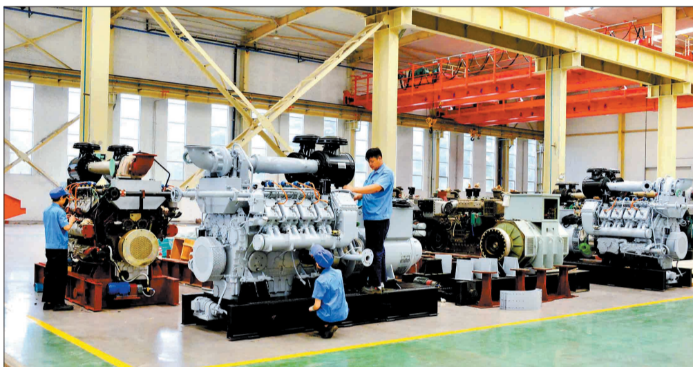
河柴重工自主研发的高速大功率柴油机各项指标达到国际先进水平