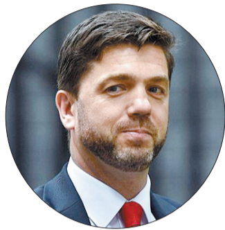
▲ 保守党 前内阁大臣 斯蒂芬·克拉布 被曝曾向一名年轻女性求职者发送露骨短信和向另一名女性发色情信息