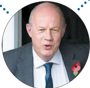
▶ 首席大臣 达米安·格林 被一名女记者指控 曾碰触其膝盖