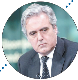
▲ 国际贸易部副大臣 马克·加尼尔 被曝2010年要求女秘 书代买性玩具