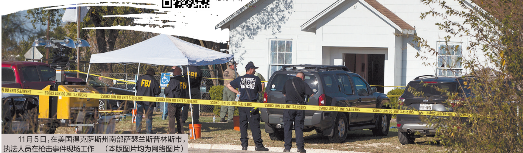
11月5日，在美国得克萨斯州南部萨瑟兰斯普林斯市，执法人员在枪击事件现场工作（本版图片均为网络图片）

按照马丁的说法，枪手死于枪伤，身上有弹孔，暂时不能确定他是自杀，还是被那名居民开枪打中后伤重而亡。执法人员在车内找到多件武器。