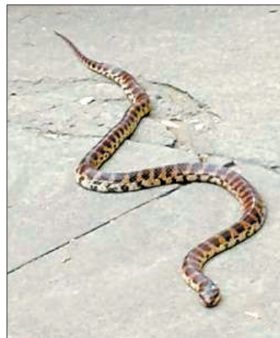
在校园里“闲逛”的蛇 (微博图片)

赤链蛇为无毒蛇,但因其食物中包含蟾蜍,所以进食后口中可能带有蟾蜍毒液。一般身长约1米,最长可达1.5米以上。体背黑褐色。因具有60条以上的红色窄横纹而得名,以鱼、蛙、蟾蜍、蜥蜴、蛇、鸟等为食。