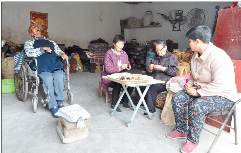
一家人在一起做工

哪个婆婆不想有个好媳妇?婆婆好,家境好,媳妇好,这倒也和谐,但连婆婆都说自己脾气躁,家里又接二连三出事情,在逆境中,她依然是个好媳妇,“小棉袄”就忍不住要把她的故事跟大家说道说道了。