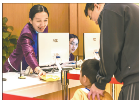
雄鹰体检用微笑服务顾客