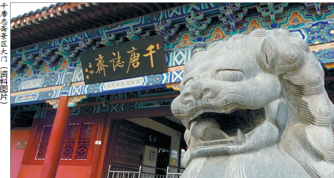
千唐志斋景区大门(资料图片)