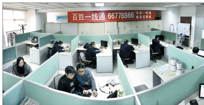
市热力公司相关负责人及工作人员解答市民的“热”问题