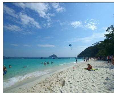
泰国普吉珊瑚岛海滩