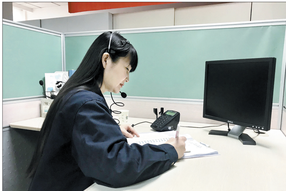
新区热力分公司工作人员接听市民来电并记录问题