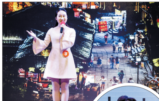
模拟现场导游讲解