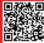
扫二维码, 听记者原声诵读

十九大报告原文:我们要建设的现代化是人与自然和谐共生的现代化,既要创造更多物质财富和精神财富以满足人民日益增长的美好生活需要,也要提供更多优质生态产品以满足人民日益增长的优美生态环境需要。