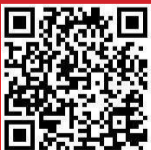
扫二维码, 听记者原声诵读

十九大报告原文:坚持房子是用来住的、不是用来炒的定位,加快建立多主体供给、多渠道保障、租购并举的住房制度,让全体人民住有所居。