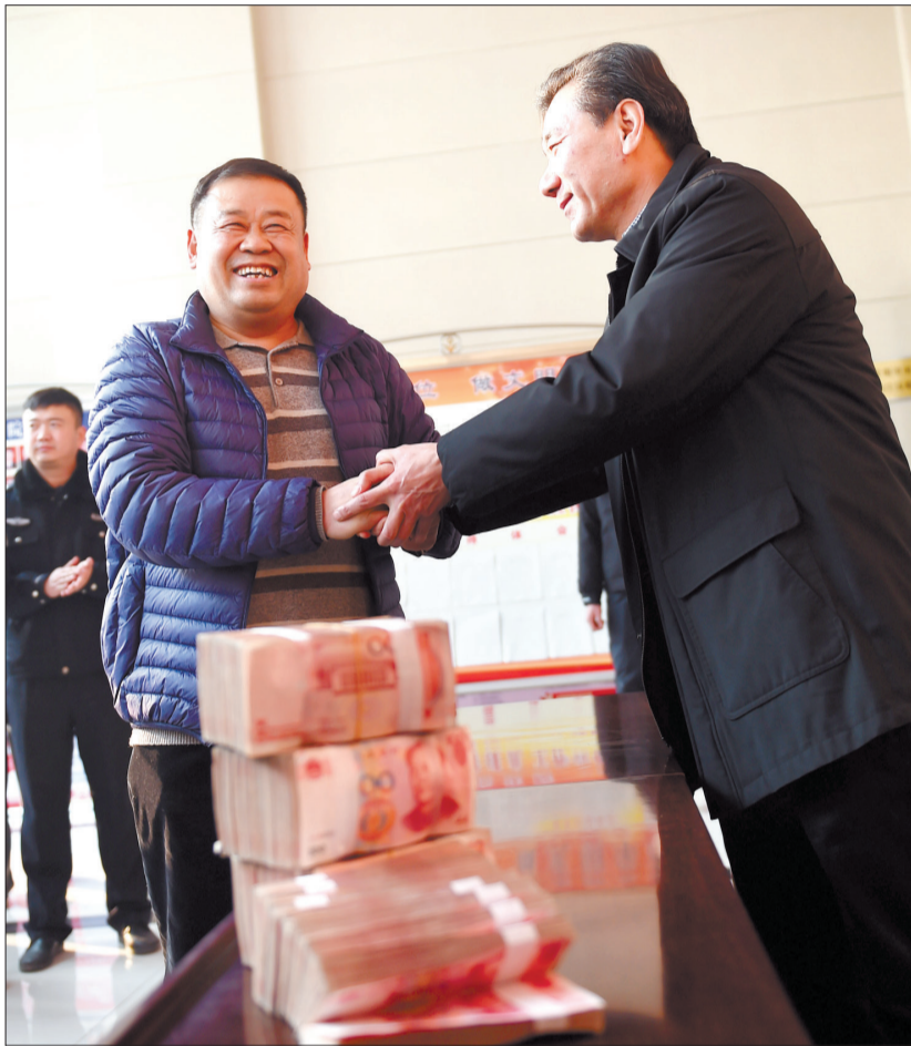
武师傅(中)代表工友向新安县人民法院表示感谢

绿色通道已在全市人民法院开通； 农民工没钱打官司，还可享受诉讼费 “缓、减、免”政策