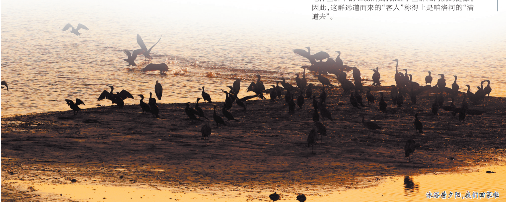
沐浴着夕阳，我们回家啦