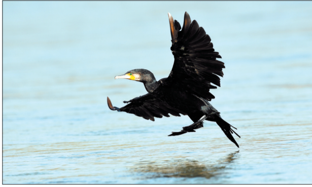
看！这降落的姿势优美吧