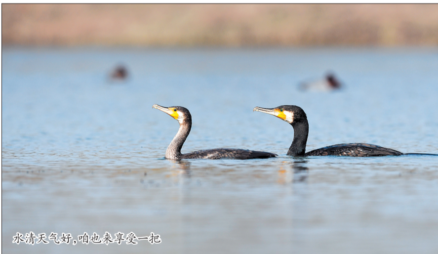
水清天气好，咱也来享受一把

“蓝色大海”说，这些年，来我市越冬的普通鸬鹚数量越来越多，这说明洛河中鱼类增多了，普通鸬鹚吃掉鱼群中的老弱病残，保证了鱼群和河流的健康。因此，这群远道而来的“客人”称得上是咱洛河的“清道夫”。