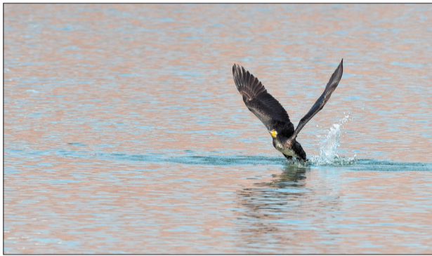
作为洛河“清道夫”，我是最帅的