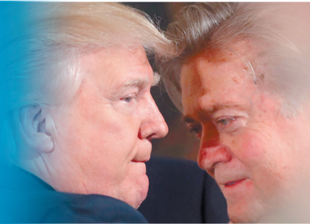
特朗普(左)与班农交谈