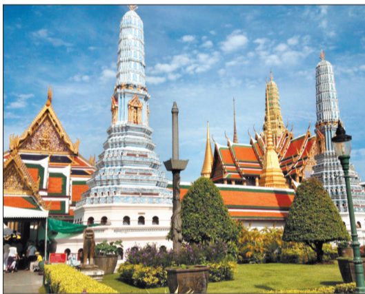
泰国曼谷(资料图片)