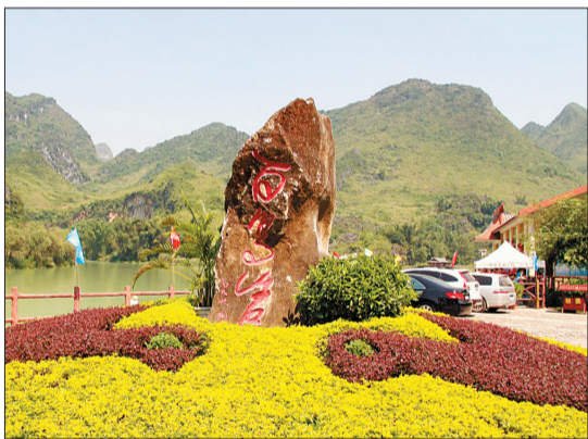
巴马一景(资料图片)