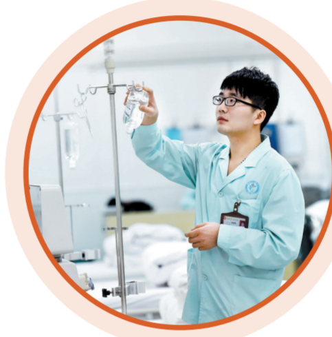
跪别老患者的90后男护士