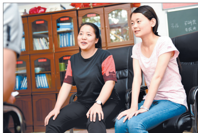
这俩女生当“谈判专家”智救轻生女