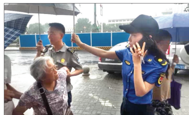
女城管雨天为受伤老人撑伞