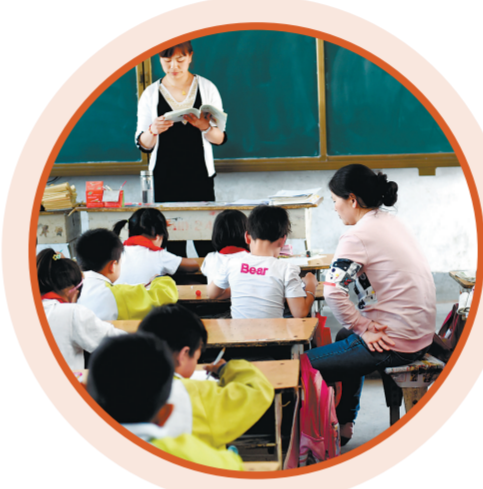
37岁妈妈(右)陪脑瘫女儿上学