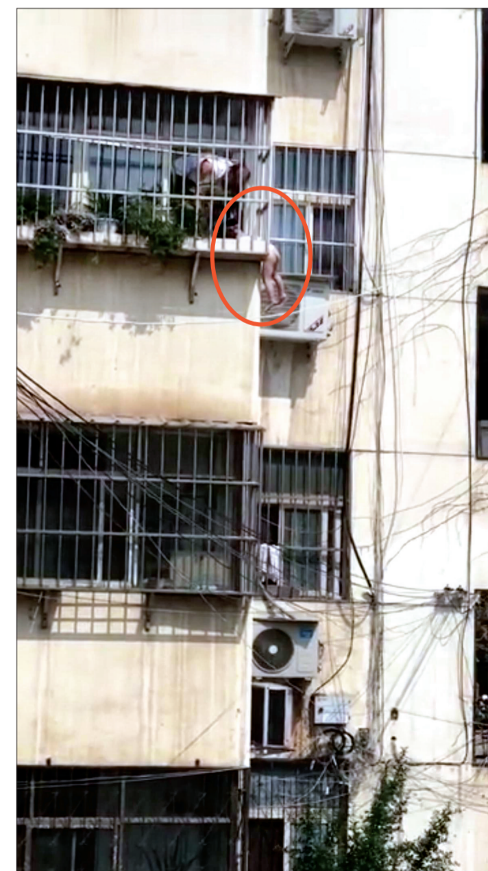
3岁男童(圈内)被卡防盗窗,热心市民全力营救(本版图片均为资料图片)