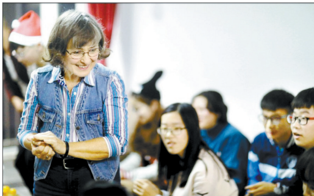
在洛义务教英语的美国人尚心语