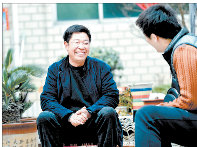
面对31万元巨款不动心的老闫(左)接受采访