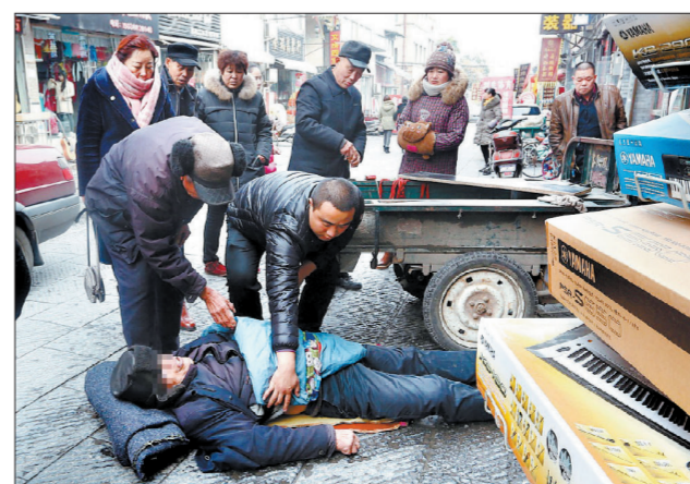
好小伙儿为晕倒老人盖被单并施救