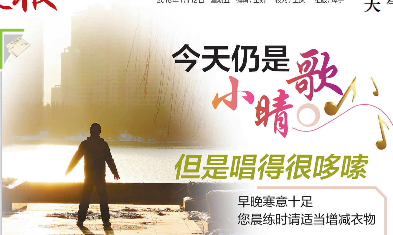
太阳初升,一名市民在洛河边锻炼身体