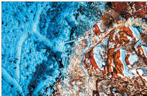
航拍万安山七彩大峡谷