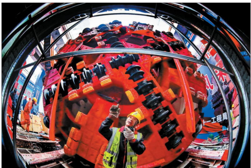
洛阳加快步入“地铁时代”