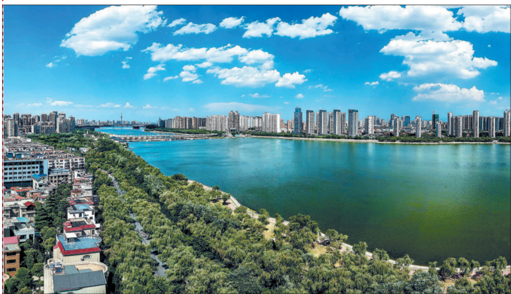
洛阳环境污染治理成效初显