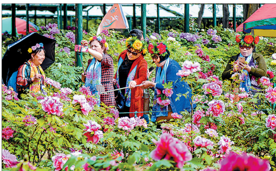
洛阳以节惠民措施受到社会各界广泛好评