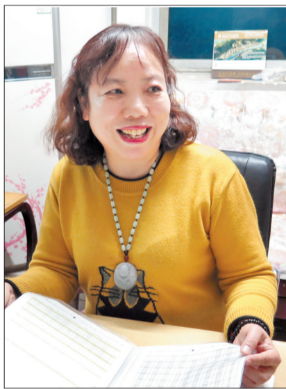
玉琼(网名) 59岁 打工

家人心声:李露明的儿子和爱人都支持他退而不休。儿子说,爸爸不爱打牌、玩游戏,教书是他最爱做的事情。既然爸爸喜欢,就支持他去做,他开心就好。每次看到爸爸下课回家脸上挂着笑容,他们兄妹和妈妈就很满足。