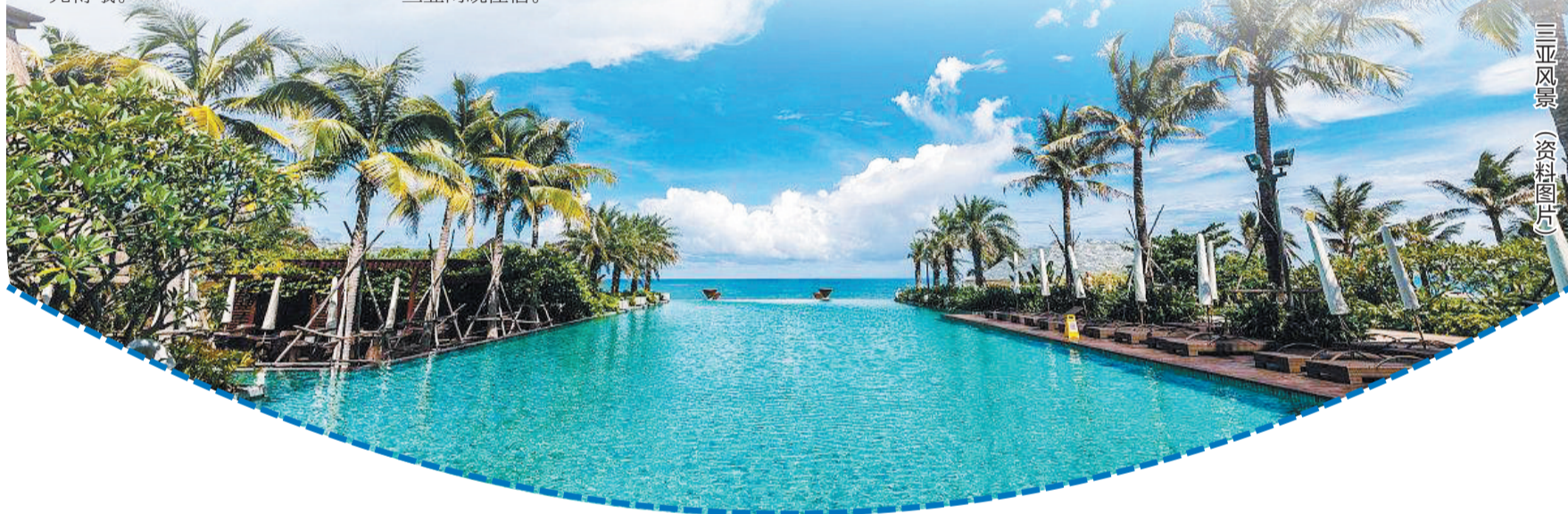
三亚风景 (资料图片)

地址:涧西区南昌路与九都路交会处创展国际贵都2单元14楼1409室(西苑公园对面) (邱明)