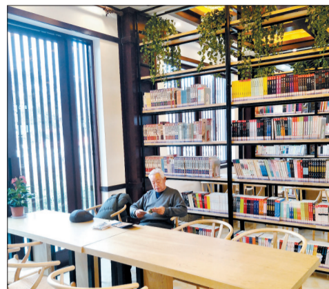
紫微书院一角

冬日里，除了可以宅在家、逛商场、泡温泉，图书馆、书店也是不少人避寒、放松的新选择。今天，记者就向您推荐两处我们身边的读书好去处。